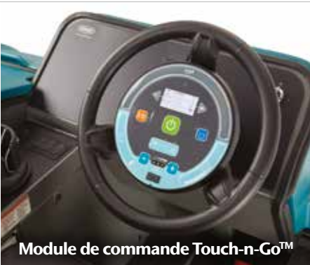
Module de commande Touch-n-Go™