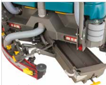
Bac à déchets