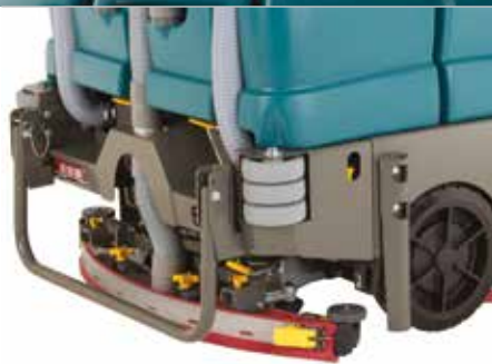
Bavette parabolique Dura-Track™