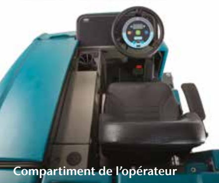
Compartment de l'opérateur