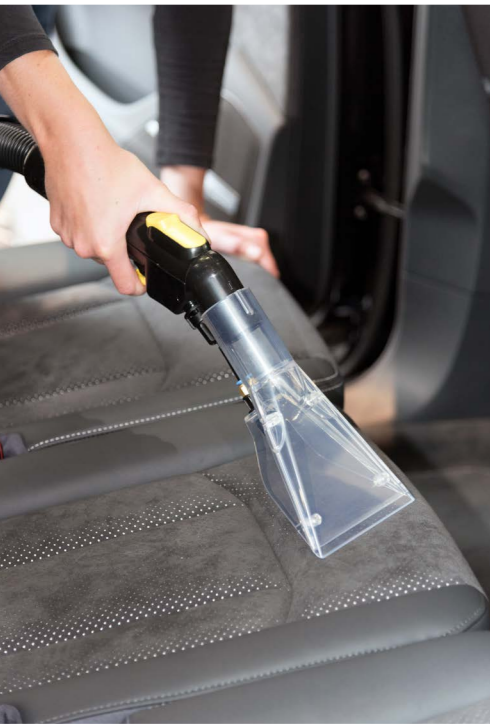
Embout à coussin pour le nettoyage de sièges auto par ex. La fonction de vaporisation est réglable à l'aide de la poignée de commande.