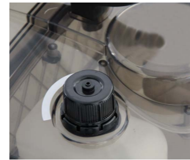
Un réservoir séparé permet l'utilisation d'un produit anti-moussant et garantit ainsi un travail aisé.