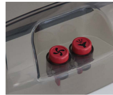
Boutons de sélection distincts sur l'appareil pour choisir entre fonction d'aspiration et de pulvérisation.