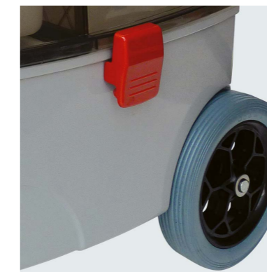
Les grandes roues non marquantes en caoutchouc pour les travaux de voie libre.