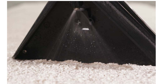
Le produit de nettoyage est pulvérisé selon les besoins.