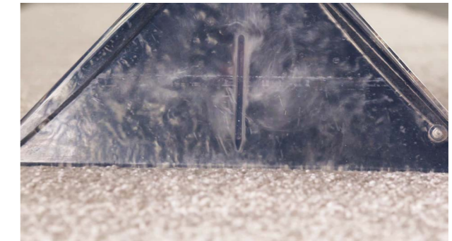
Ensuite, la saleté est aspirée, y inclut le liquide.