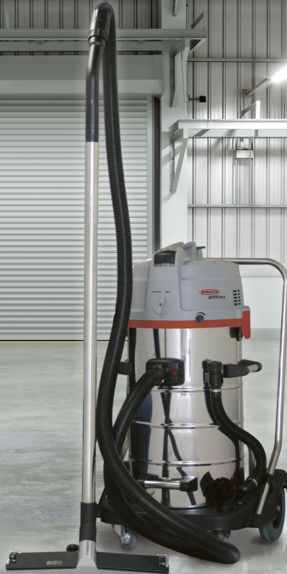
L'illustration avec l'embout de sol en métal optionnelle. N° article 102.051