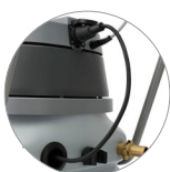
Prise d'alimentation de la pompe d'évacuation