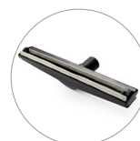
Suceur sol liquide avec roulettes latérales