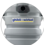
Réservoir en plastique résistant aux chocs