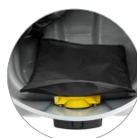
Filtre à tamis pour les saletés grossières