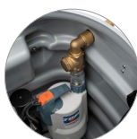
Pompe d'évacuation intégrée à déclenchement rapide