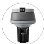
Deux moteurs commandables et système flottant