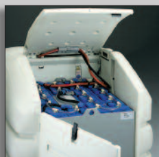
Large compartiment à batterie