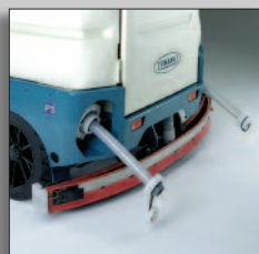
Tuyau de vidange pratique