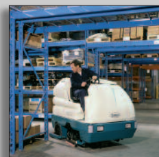
Machine en action